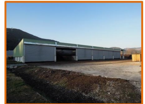
Couverture des casiers de compostage existants