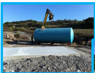
Déplacement de la réserve d'eau de 8.00ml